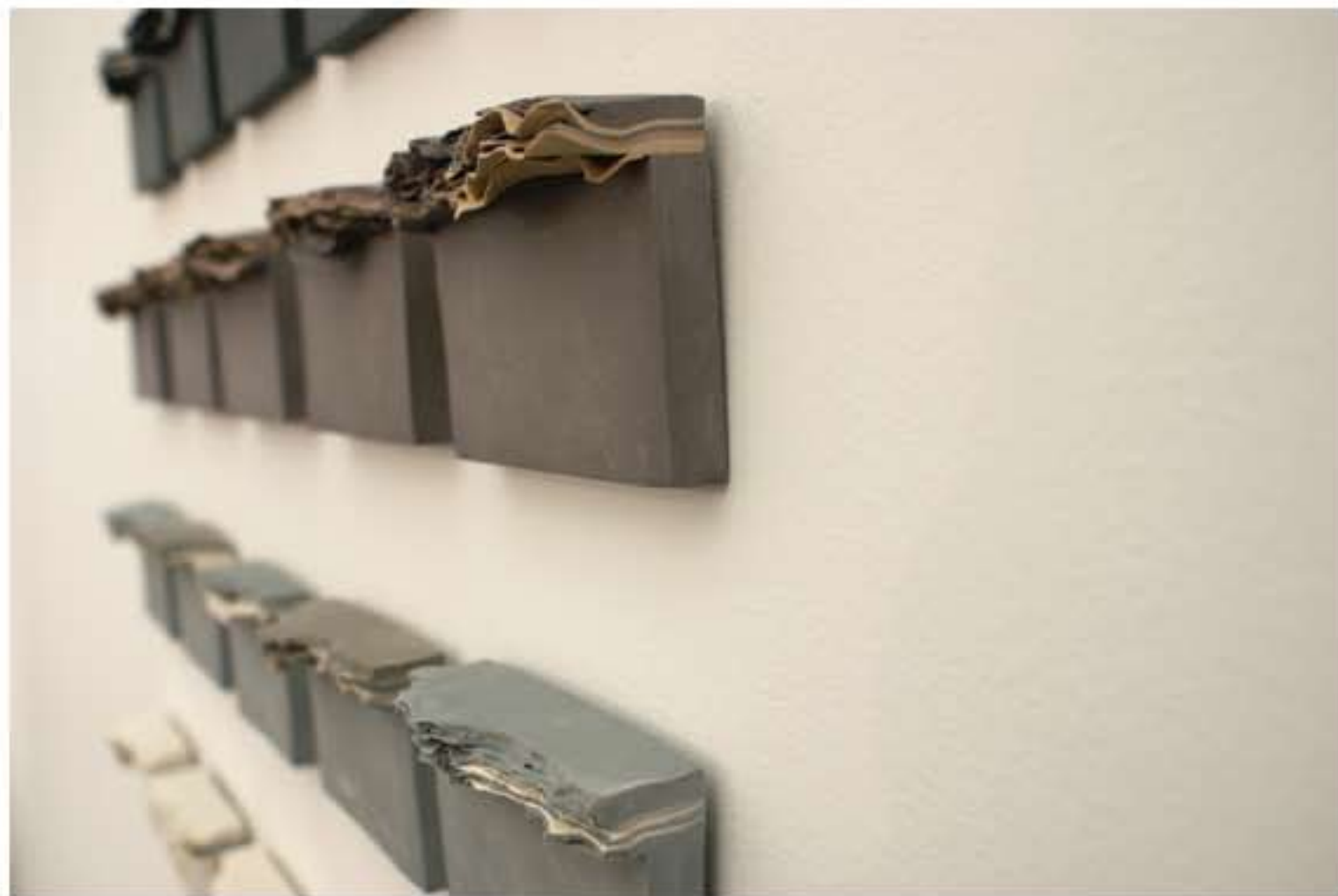
DESSINE-MOI UNE MONTAGNE, détail