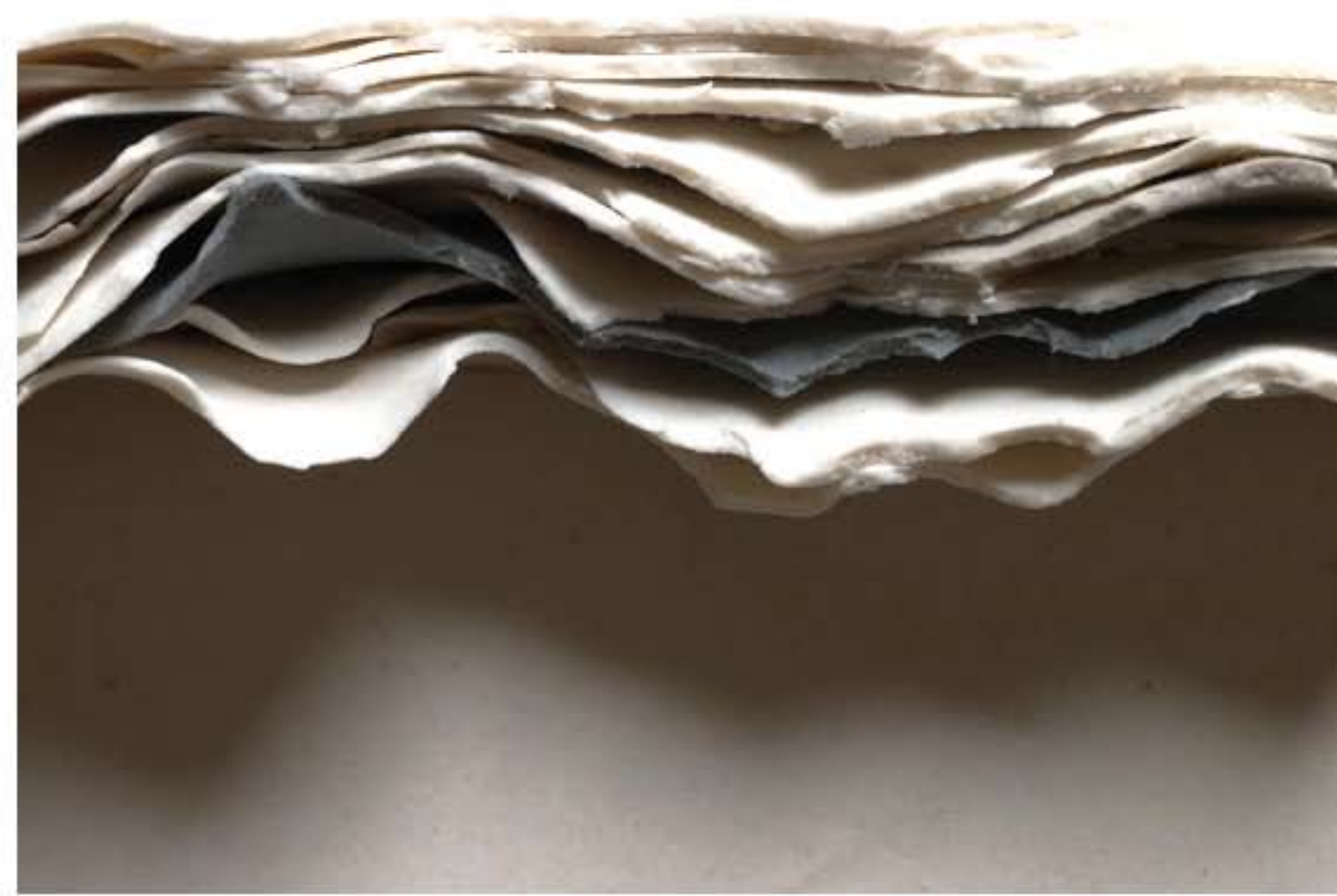
DESSINE-MOI UNE MONTAGNE, détail