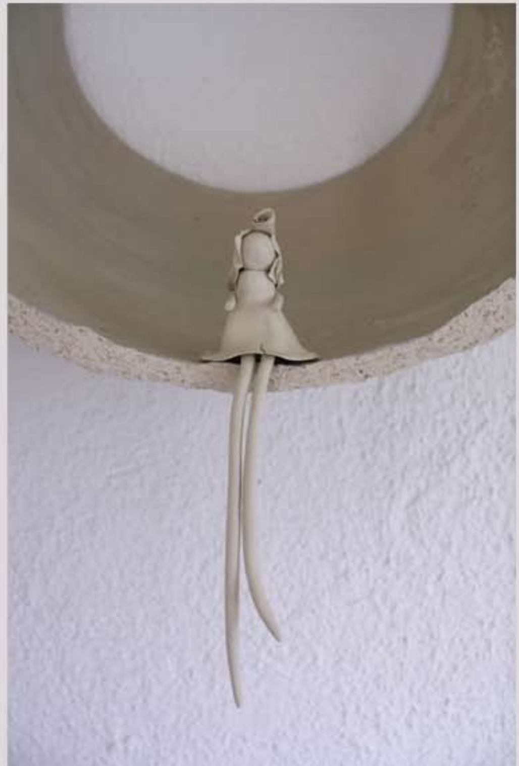
AU BORD DU MONDE, détail