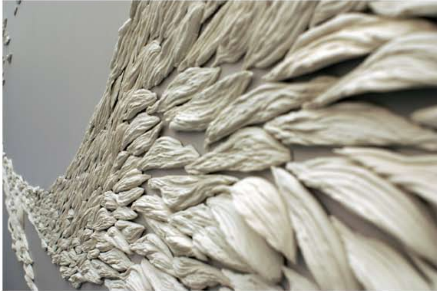
RÊVERIE Series, détail