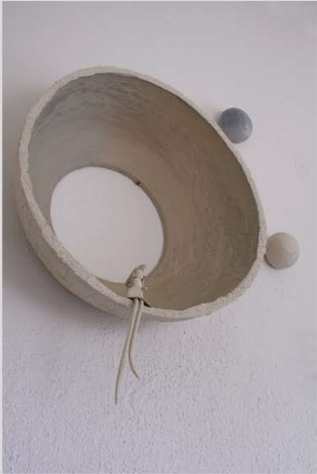
AU BORD DU MONDE, détail